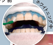
ホワイトニング中