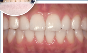
ホワイトニング後