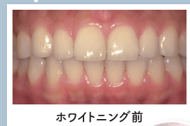
ホワイトニング前

「V-CAT®(可視光応答型光触媒)」の応用で、 比較的低い過酸化水素濃度で 高いホワイトニング効果と低刺激性を両立