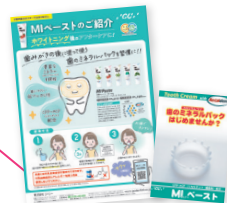
医院スタッフ様向け 患者様向け

CPP-ACP(リカルデント™)は、牛乳由来タンパク質の分解物であるカゼインホスホペプチド(CPP)と、非結晶性リン酸カルシウム(ACP)の複合体です。CPP-ACPはカルシウムとリンを過飽和状態(高濃度)で口腔内に供給してくれます。