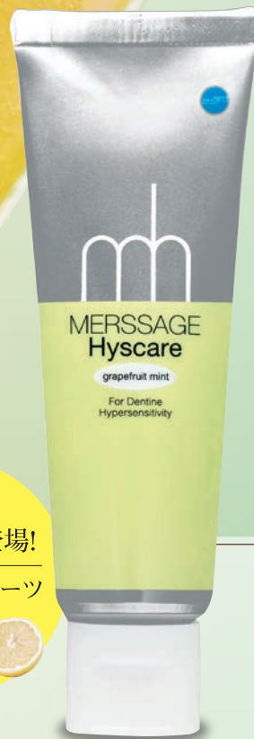
グレープフルーツミント