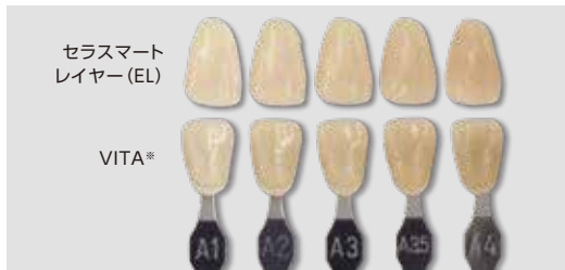
*VITAはVita Zahnfabrik H.Rauter GimbH & Co.KGの商標です。