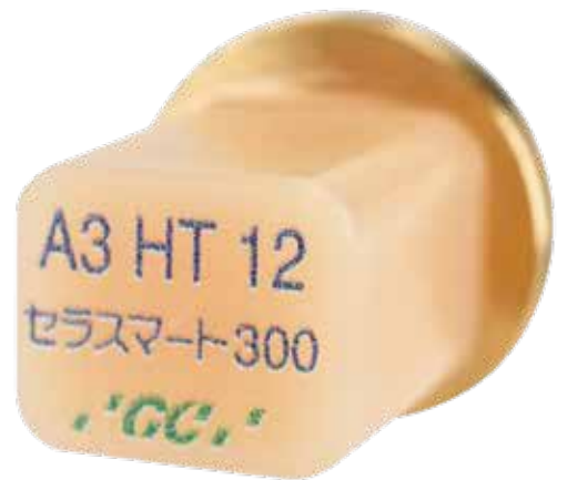
歯科切削加工用レジン材料 セラスマート レイヤー 管理医療機器 231AKBZX00004000