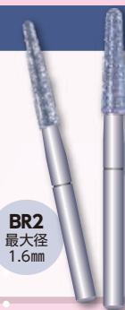
BR2 最大径 1.6mm