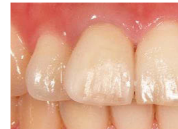
ツヤを失った補綴・修復物