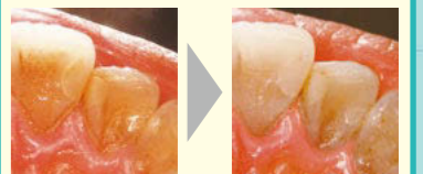
軽度のステインも除去できます