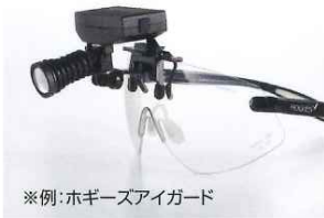
※例：ホギーズアイガード

バッテリー交換はマグネット固定式なので簡単。さらに、診療中の予備として使用できる2個目のバッテリーを標準付属しています。