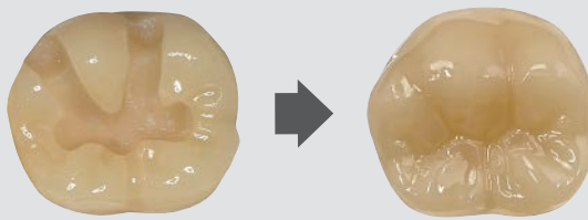
窩洞模型 (A4) にDarkを充填