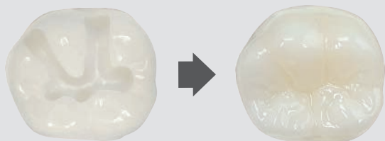
窩洞模型 (AO) にWhiteを充填