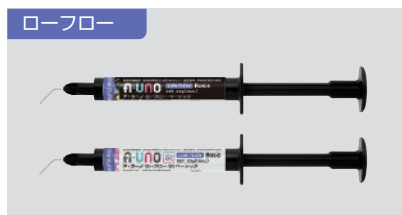
ア・ウーノ ローフロー (ベーシック / St ベーシック / St White / St Dark) 各 2.8g (1.5mL) 2,900円