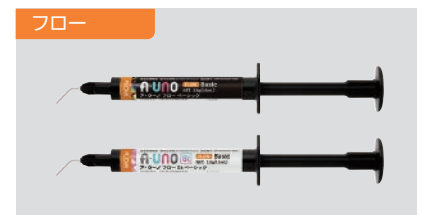
ア・ウーノ フロー (ベーシック / St ベーシック / St White / St Dark) 各 2.8g (1.5mL) 2,900円