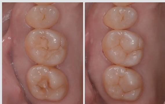
Darkを象牙質部分に充填し、ベーシックをエナメル質部分に充填