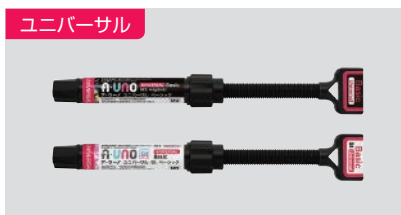
ア・ウーノ ユニバーサル (ベーシック / St ベーシック) 各 4.0g (2.0mL) 2,900円