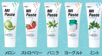
メロン ストロベリー バニラ ヨーグルト ミント