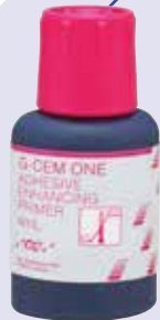
歯科用象牙質接着材 管理医療機器 228AKBZX00104000