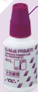
歯科セラミックス用接着材料 管理医療機器 228AABZX00003000